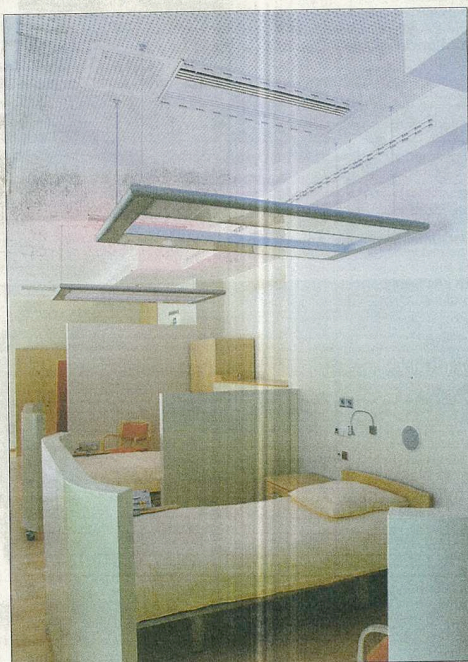
Die neuen Bäder werden viele Mitmenschen aufnehmen werden, die